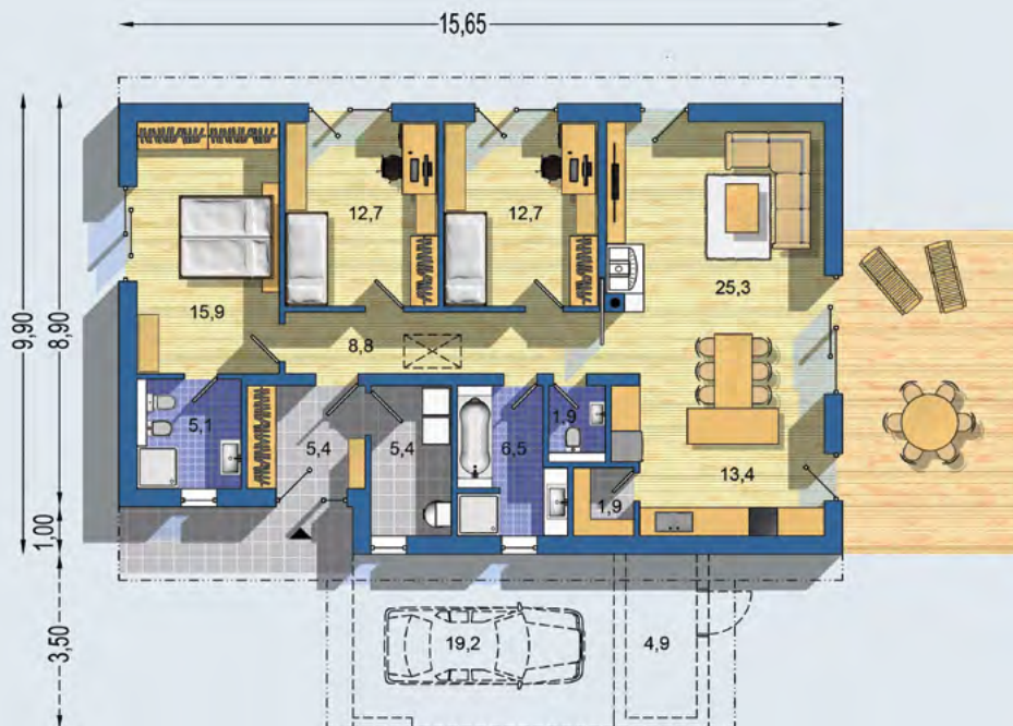
PŘÍZEMÍ [celková plocha 114.9 m 2 ]

BUNGALOV 2277 - praktický 4-pokojový bungalov s účelnou kompaktní dispozicí - s ekonomickým konstrukčním řešením bez pevného stropu, se sádkartonovým podhledem - skladovací prostor v části podkrovní přístupný sklápěcím schodištěm - dva identické dětské pokoje - rodičovská ložnice s vlastní koupelnou - atraktivní prostorný hlavní obytný prostor - chráněný překrytý vstup do domu - samostatná technická místnost - možnost přístavěného přístřešku se zahradním skladem