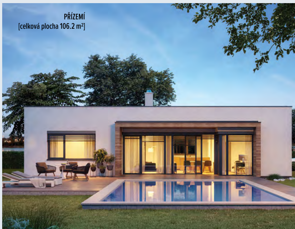
PŘÍZEMÍ [celková plocha 106.2 m 2 ]

VILA 2061 - netradiční půdorys se společenskou částí uprostřed - na hlavní obytný prostor navazuje částečně překrytá terasa - noční část je rozdělená na dva samostatné celky – rodičovská ložnice je na opačné straně než samostatná část s dětskými pokoji - hlavní obytný prostor je dobře osvětlený z protilehlých stran a zároveň velká prosklená plocha je chráněná zastřešením - poloha technické místnosti zaručuje její dobré akustické oddělení - moderní vzhled, jednoduchá výstavba . . .