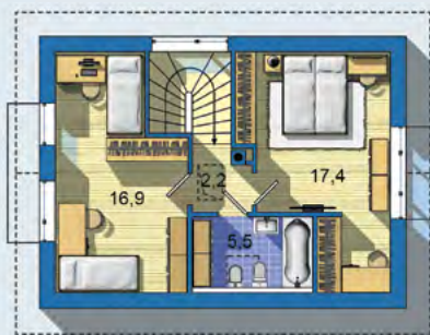
POSCHODÍ [celková plocha 42.0 m 2 ]