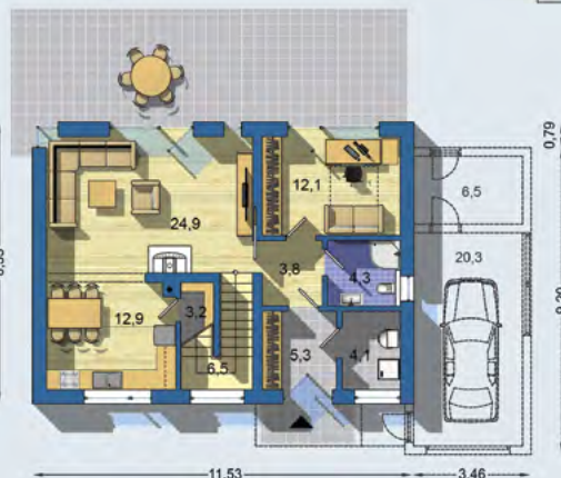
PŘÍZEMÍ [celková plocha 77.0 m 2 ]

Návrh dispozice půdorysu rodinného domu je architektonickým dílem podle § 2 odst.1 Autorského zákona č. 121/2000 Sb. Jeho porušení je trestné podle § 270 Trestního zákoníku č. 40/2009 Sb.