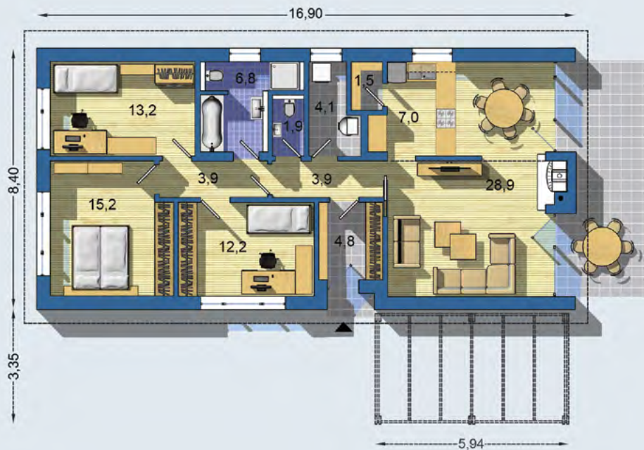
PŘÍZEMÍ [celková plocha 103.5 m 2 ]

BUNGALOV 1678 - jednoduchý bungalov vhodný i na úzké parcely - obývací pokoj se zvýšeným stropem, navazující na jídelnu a částečně oddělenou kuchyň - noční část je důsledně oddělená od obývacího pokoje - samostatná technická místnost - velké pokoje navzdory malé zastavěné ploše - úsporné řešení bez stropní konstrukce, jednoduchá výstavba, moderní vzhled - atraktivní, bohatě prosvětlený hlavní obytný prostor s krbem - možnost přístavby přístřešku pro automobil - fasádní obklad je možné nahradit omítkou nebo jiným typem obkladu podle fantazie majitele . . .