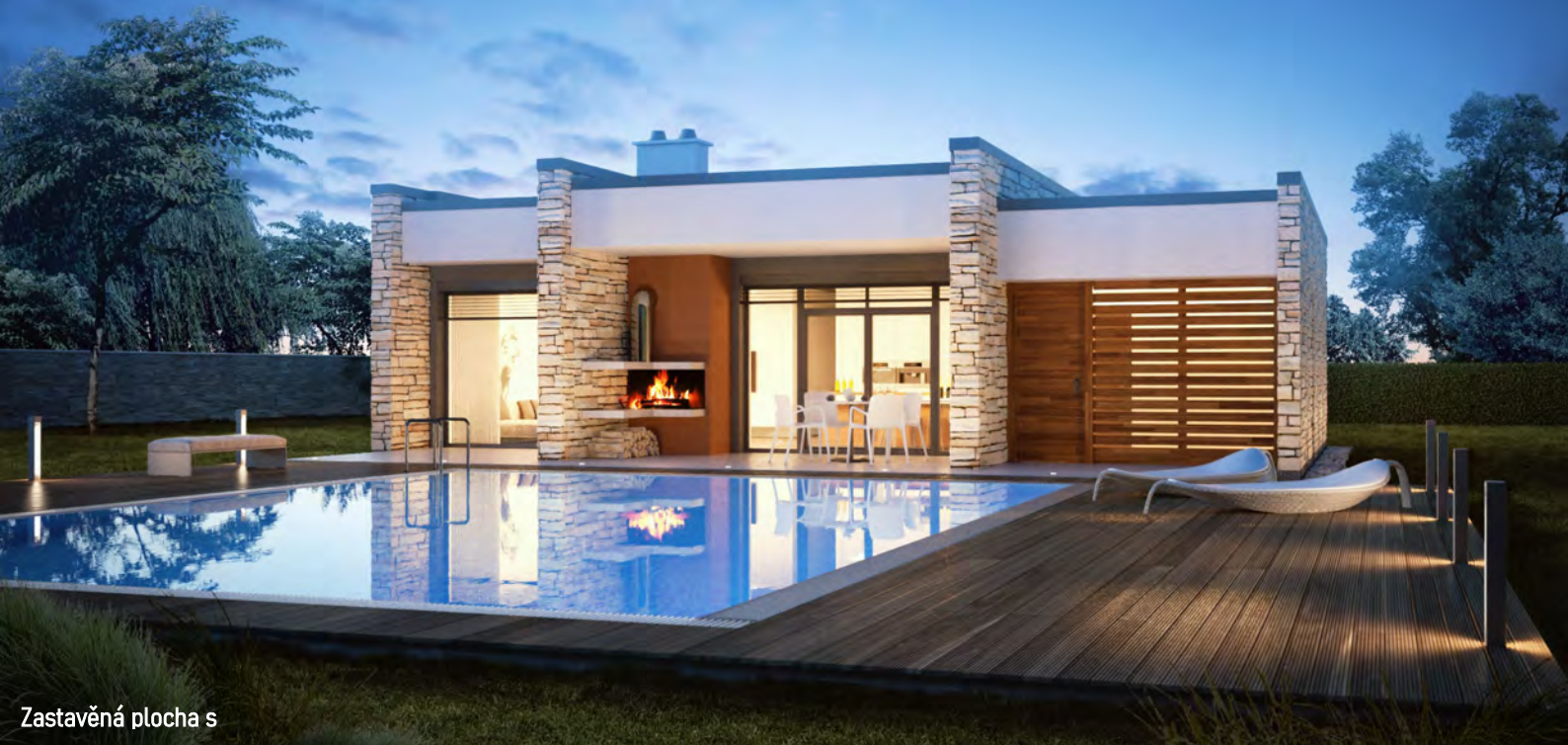
Zastavěná plocha s