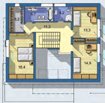
POSCHODÍ [celková plocha 74.9 m 2 ]

AKTIV BASE 2024 - elegantní podkrovní dům v nízkoenergetickém standardu s důrazem na optimální rozložení místností vzhledem na světové strany - moderní obytný velkoprostor navazující na krytou terasu - obývací pokoj shora prosvětlený střešními okny a otevřený až po galerii v podkroví - komfortní pokoje a nadstandardní množství úložných prostorů - garážová vrata je možné umístit vedle vstupu do domu nebo kolmo vzhledem ke vstupu - - -