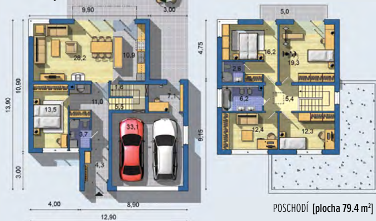
POSCHODÍ [plocha 79.4 m 2 ]