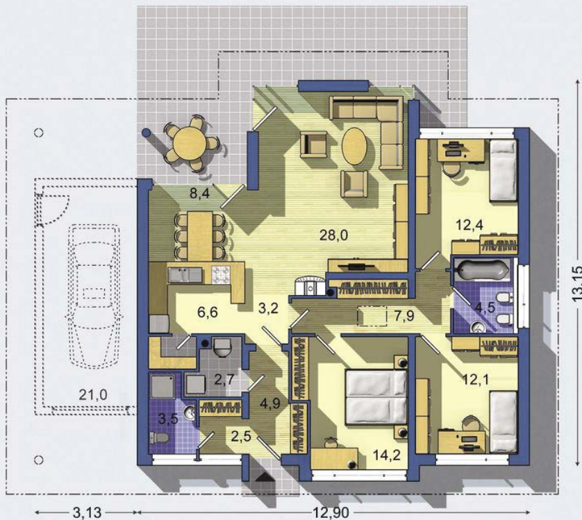
PŘÍZEMÍ [celková plocha 112.3 m 2 ]

Návrh dispozice půdorysu rodinného domu je architektonickým dílem podle § 2 odst.1 Autorského zákona č. 121/2000 Sb. Jeho porušení je trestné podle § 270 Trestního zákoníku č. 40/2009 Sb.