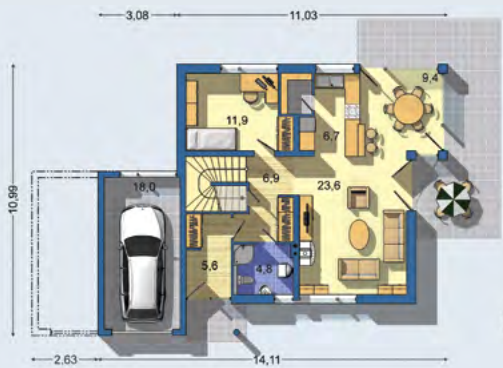
PŘÍZEMÍ [plocha 96.0 m 2 ]