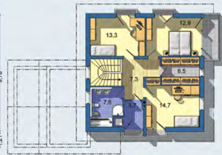
POSCHODÍ [plocha 70.8 m 2 ]