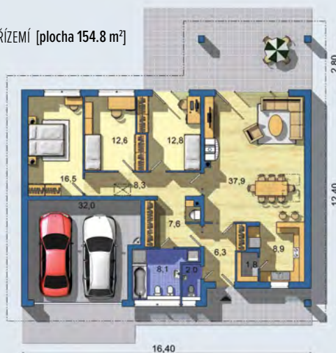
PŘÍZEMÍ [plocha 154.8 m 2 ]