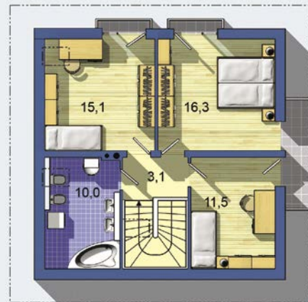
POSCHODÍ [celková plocha 60.0 m 2 ]

Návrh dispozice půdorysu rodinného domu je architektonickým dílem podle § 2 odst.1 Autorského zákona č. 121/2000 Sb. Jeho porušení je trestné podle § 270 Trestního zákoníku č. 40/2009 Sb.