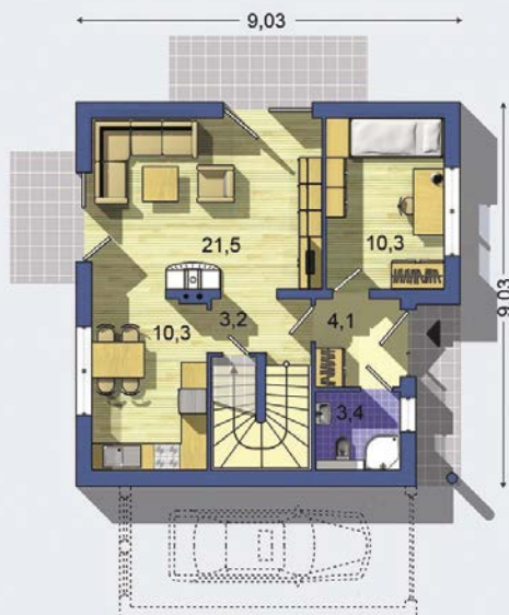
PŘÍZEMÍ [celková plocha 60.3 m 2 ]