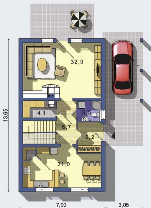
PŘÍZEMÍ [celková plocha 81.8 m 2 ]