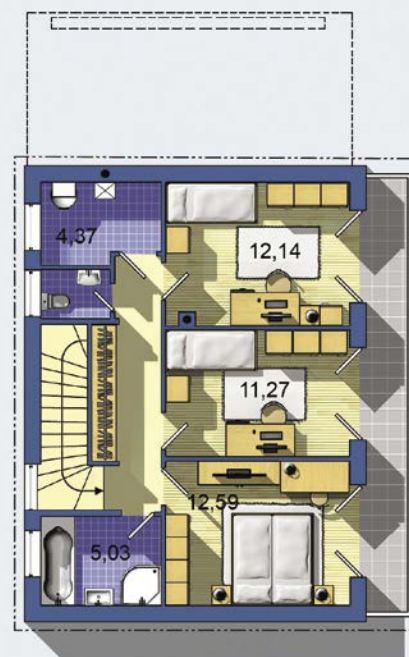
POSCHODÍ [celková plocha 64.3 m 2 ]

Návrh dispozice půdorysu rodinného domu je architektonickým dílem podle § 2 odst.1 Autorského zákona č. 121/2000 Sb. Jeho porušení je trestné podle § 270 Trestního zákoníku č. 40/2009 Sb.