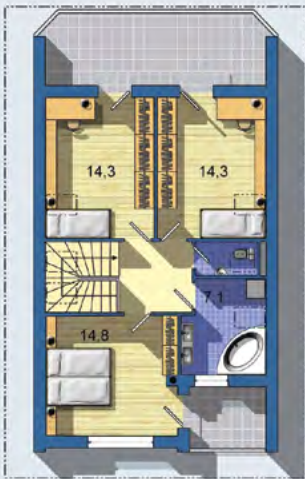
POSCHODÍ [plocha 77.3 m 2 ]