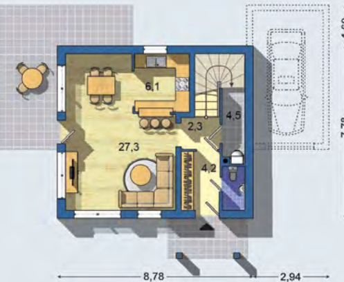
POSCHODÍ [plocha 50.6 m 2 ]