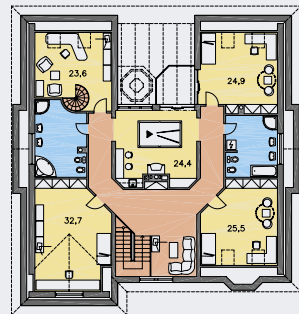
POSCHODÍ [plocha 123.2 m 2 ]