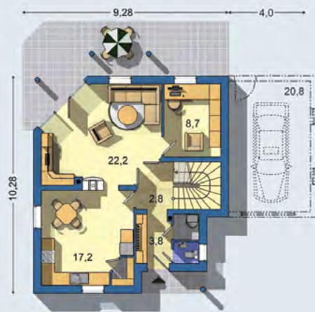
PŘÍZEMÍ [plocha 64.8 m²]